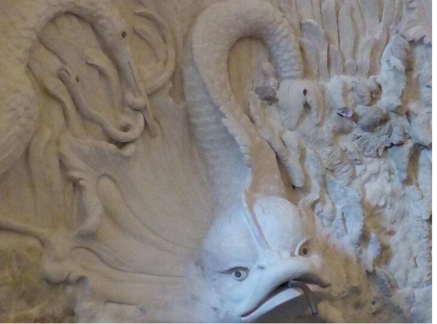
Visite guidée Saint-Antoine au fil du temps - Le temps des bâtisseurs : splendeurs du gothique